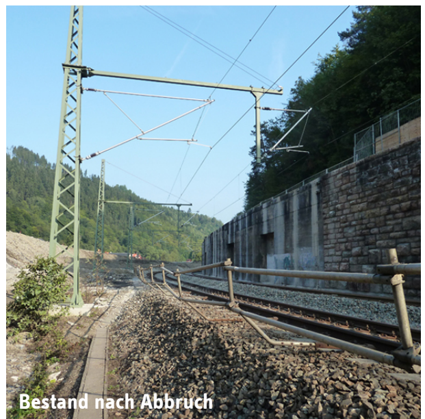
Bestand nach Abbruch

Planung zur Neugestaltung des Kreuzungspunktes der B 85 Saalfeld – Probstzella mit der DB-Strecke Leipzig/Leutzsch – Probstzella in Gabe Gottes.