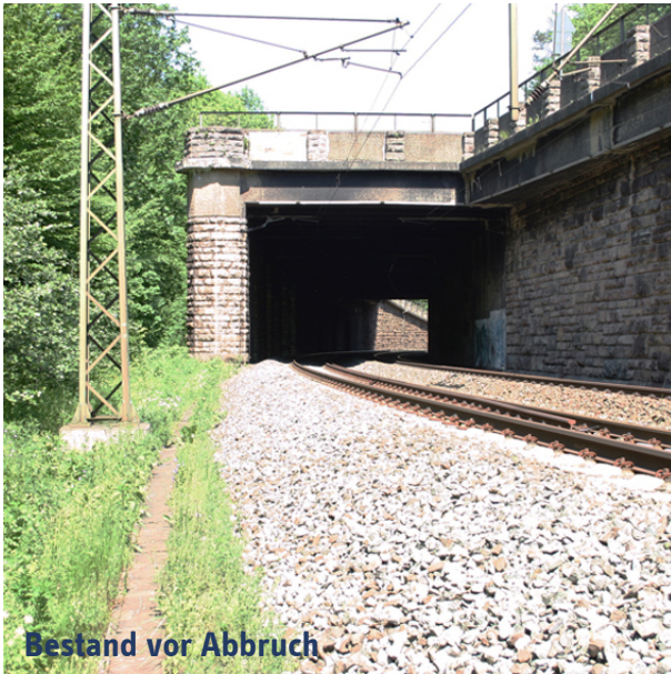
Bestand vor Abbruch