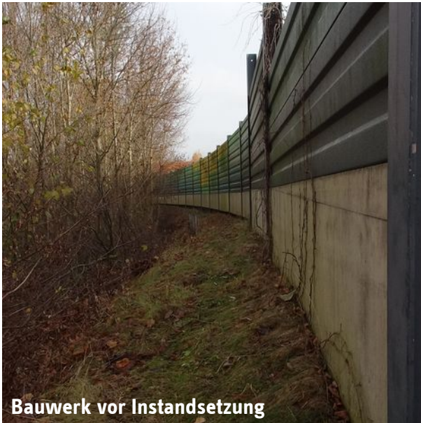
Bauwerk vor Instandsetzung