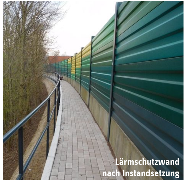
Lärmschutzwand nach Instandsetzung