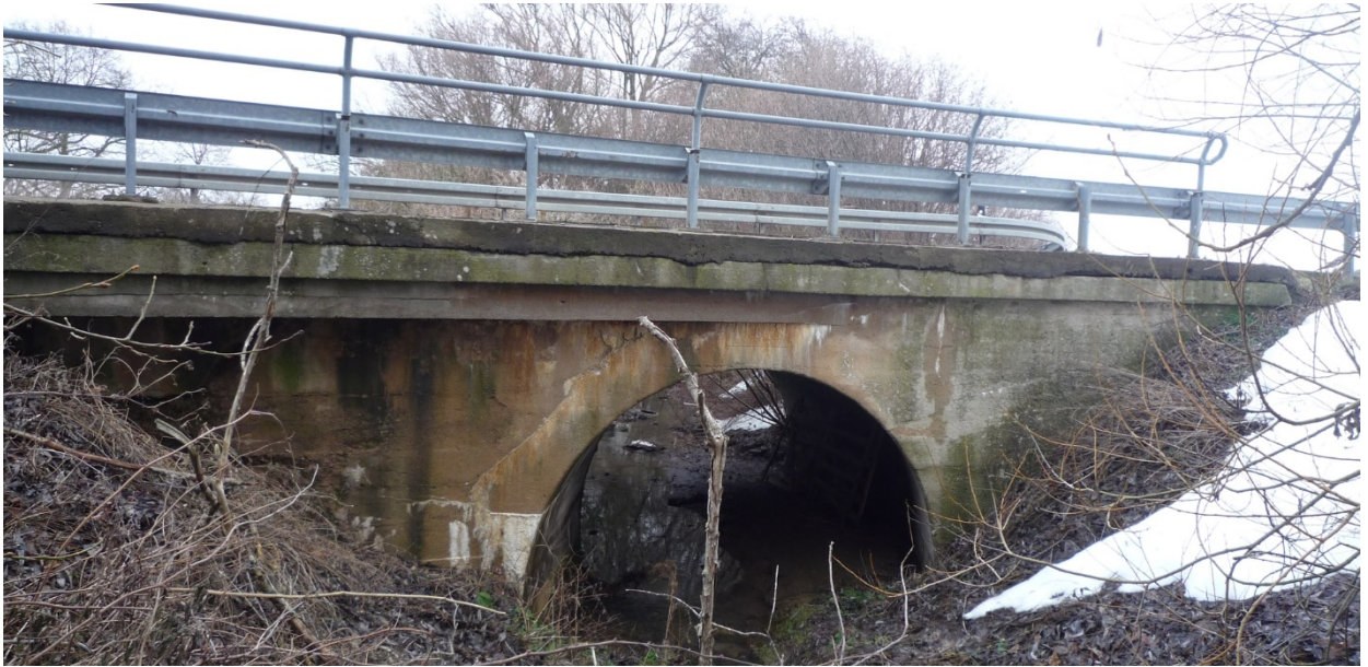
K 204 zw. Langula und Kammerforst, Brücke über den Gelbrieder Bach